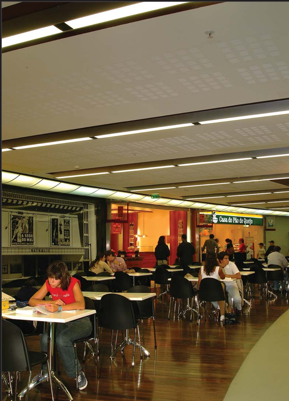
Centro Comercial Acqua Roma - Lisboa