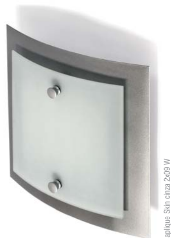
applique Skin cinza 2x09 W