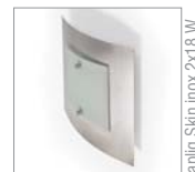
appliq. Skin inox 2x18 W